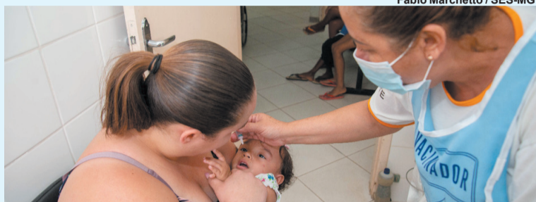
Fábio Marchetto / SES-MG

Objetivo é ampliar a cobertura vacinal e atingir a meta determinada pelo Ministério da Saúde